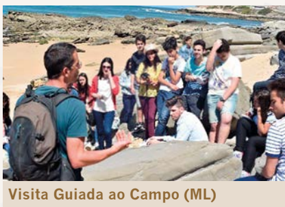
Visita Guiada ao Campo (ML)

Esta visita permite consolidar os conhecimentos adquiridos na sala de aula através do estudo das rochas das arribas, fósseis e várias estruturas presentes na paisagem, entre outros conceitos de geologia.