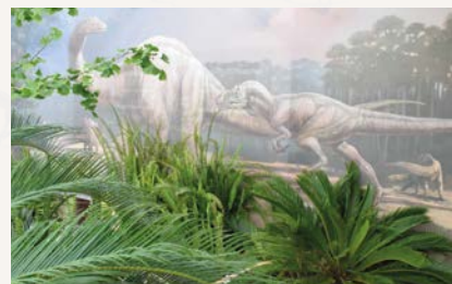
Jardim Jurássico (ML)

Informações complementares e reservas podem ser obtidas junto do Museu Lourinhã, através do email: reservas@museulourinha.org ou por telefone: 261 414 003 / 939 315 850