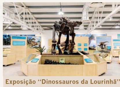
Exposição “Dinossauros da Lourinhã”

Alguns deles serviram de ponto de partida para a construção dos modelos existentes nos trilhos do Dino Parque, podendo os alunos visitá-los de forma livre.