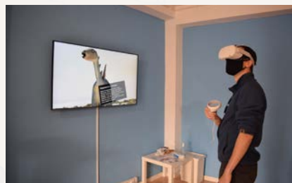
Realidade Virtual (ML)